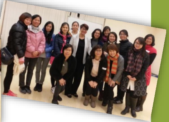
家長工作坊 年花製作班