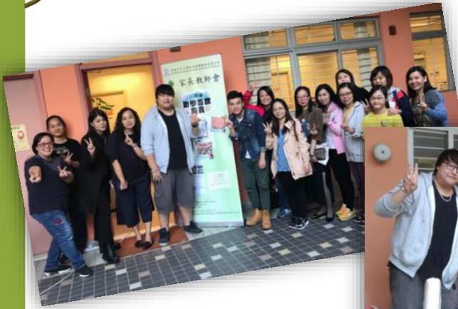
小扁擔助學義 賣籌款