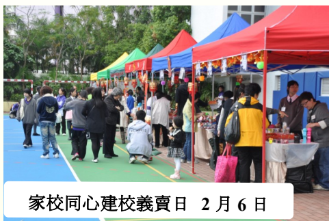
家校同心建校義賣日 2月6日

我們在沒有太多時間去籌備的『家校同心建校義賣日』，是值得令人回味的事情。回想拿著由家教會委員募集得來的一萬多元資金，為了要將成本減至最低，與數位委員兩次遠赴深圳入貨，那種狼狽情景，還歷歷在目。十二袋大包大包的精品，阻塞著整個火車卡、填滿了整個車尾箱，令人為之側目。辛苦是很辛苦，雖然這樣，幸得各委員及家長義工的幫忙，總算不負所望，超額籌得五萬五千多元的建校基金。在籌備活動的過程中看到委員們的忘我、家長義工的投入，得到參加者的讚賞及學校的支持已經很滿足了。有付出，才能深深感受到那種不可言語的滿足感。