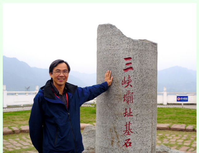
背景是湖北長江三峽工程大壩。因為國民教育沙田區委員會主辦了一個名為通識武廣高鐵之旅的活動，讓沙田區的通識老師到中國參觀，更好預備任教通識科

不少學校的一大難題是：出生率下降，收生困難，然而，本校與小學接龍，而且過去的自行收生也很理想，這個問題對本校的影響不大。政府為了解決適齡中學生減少這個問題，鼓勵全港學校參與優化教育計劃，中一減收一班。周校長表示，為了加強本校的優勢，會積極考慮優化計劃，希望藉此推行小班教學，集中資源，為新高中學制的學生做最好的準備，為下一個十年再創佳績！