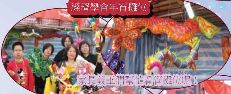
家長義工們幫忙看管攤位呢!