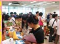
家長忙於挑選舊書的現場情況。