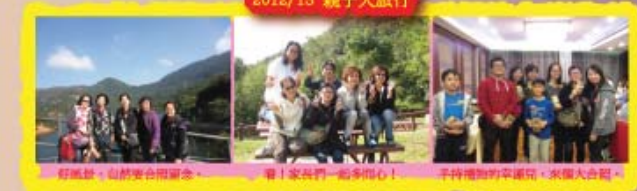
好風景，自然美合開會。 看！家長們一起多開心！ 平時難得的幸福呢，來個大合照。