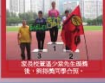
家長校董區少家先生團體後，與得獎同學合照。