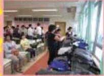
舊校服派發的現場情況。