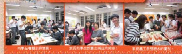
同學出席讀糖水的情況。 家長和學生訂製出馬的獎券。 家長義工發糖水的實況。