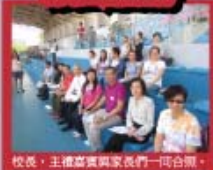
校長，主席嘉賓與家長們一同合照。