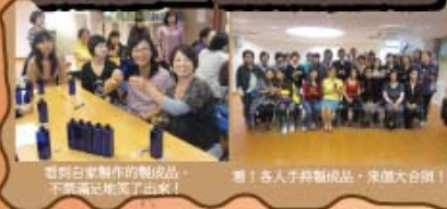
看到自家製作的製成品，不羨富足地笑了出來！ 看！各人手持製成品，來個大合照！