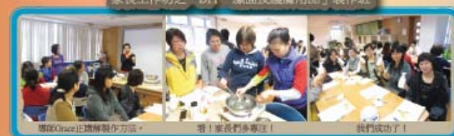
潔面Guaizheng製作方法。 看！家長們多專注！ 我們成功了！