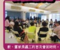
新、舊家長義工的首次會面時刻。