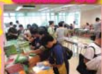
同學忙於挑選舊書的現場情況。