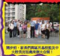
開步前，家長們與區丹昂校長及中大校長沈祖堯來個大合照！