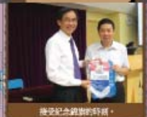
澳門浸信中學家長教師會訪及交流。