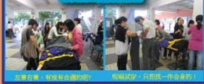
互幫互助，有沒有合適的呢？ 但願試穿，只換一件合身的！