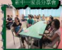
參加的家長為近年之冠，共有22人之多。