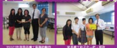
2011/12年度最高義工服務熱誠的亞軍得獎者，三哥亞輝新家長。