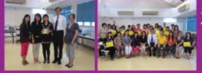
2011/12年度最高義工服務熱誠的冠軍得獎者，八哥亞輝新家長。