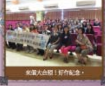
來賓大合照！好合紀念。