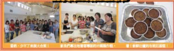
當然，少不了來個大合照！ 家長們學到地盤專業學校的示範製作。 看！新鮮出爐的布甸記蛋糕！